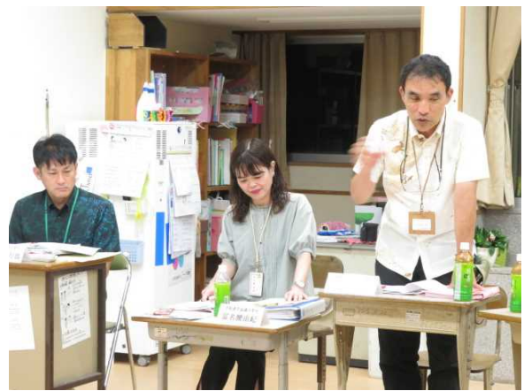
学校運営について