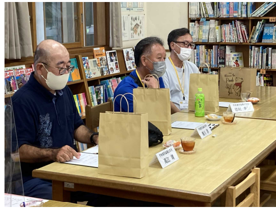
アンケート回答の様子